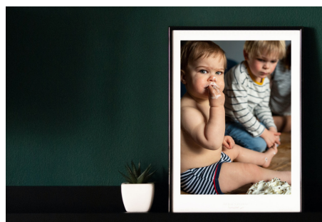
Photo encadrée format 15x20 : 30€ Photo encadrée format 30x40 : 70€ Photo encadrée format 60x80 : 100€

Photo de votre choix imprimée sur papier de haute qualité encadré dans un cadre noir à rebords blancs